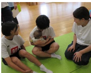
第3回 7月10日（水）中央校