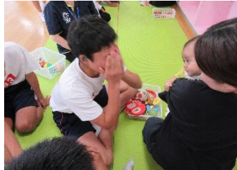
第4回 7月12日（金）中央校