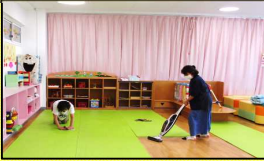
(プレイマット・床の除菌&清掃)