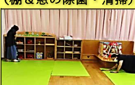
(遊具・おもちゃの除菌)