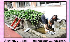
(手洗い場・側溝等の清掃)