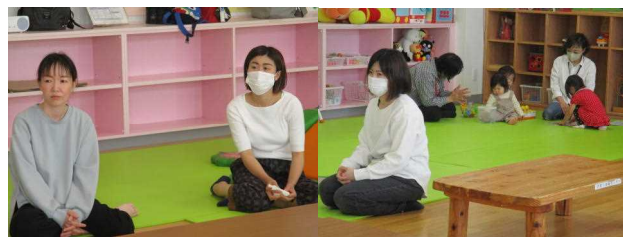
お話には耳と心をしっかりと傾けるお母さま